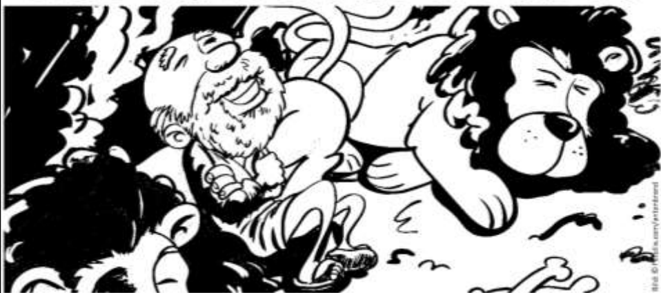
Illustration: © 2014, www.gartenkunst.com